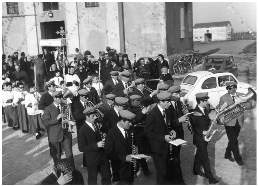
Il complesso bandistico di SESSO durante un servizio nel 1960