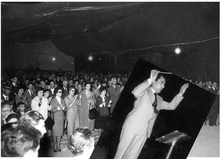
Il pubblico presente durante il concerto nel 1961